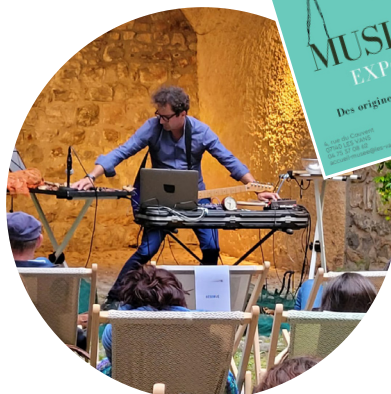
Performance du 1 er juin par Braquage Sonore et Cie