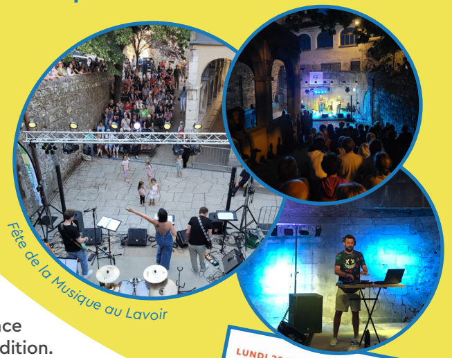
Fête de la Musique au Lavoir